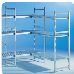
Beispiel Rega Almo Norm 20