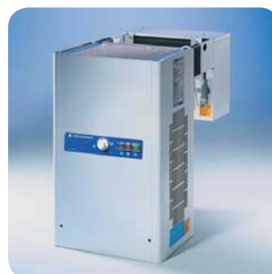
Huckepack-Aggregat mit T-Regelung